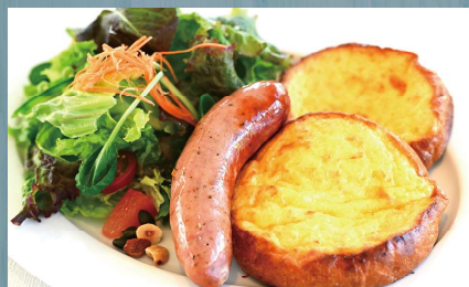
フレンチトースト (卵・乳・小麦・ナッツ類・お酒)