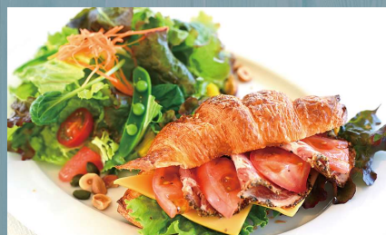
クロワッサンサンド (卵・乳・小麦・ナッツ類)