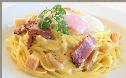
カルボナーラ (卵・乳・小麦)