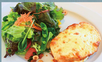
クロックムッシュ (乳・小麦・ナッツ類)