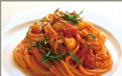
モッツアレラとバジルのトマトソース (乳・小麦)